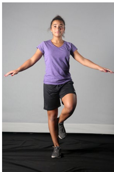
Équilibre sur un pied