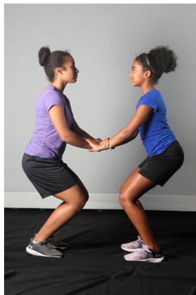
Accroupissement en tandem