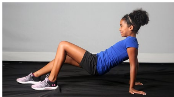
Marche du crabe