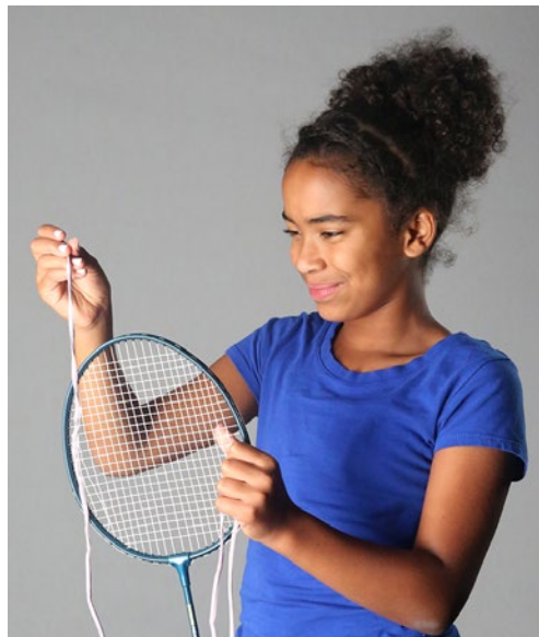
Lacet faufile dans la raquette