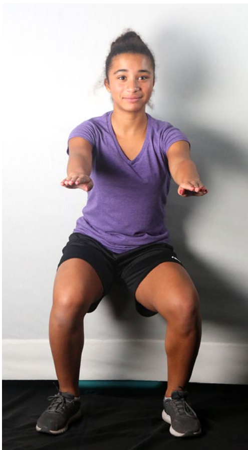
Accroupissement au mur