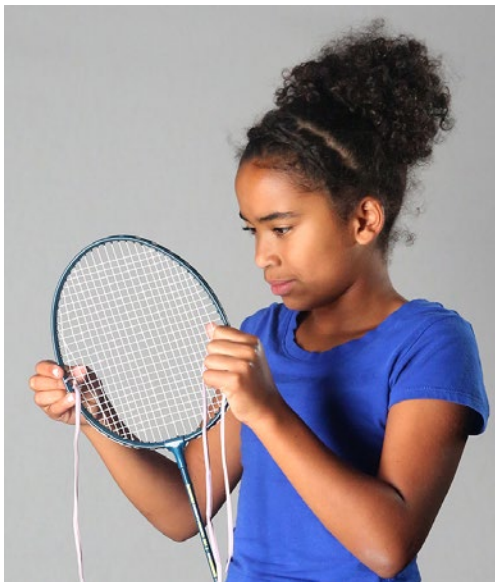
Raquette et lacet